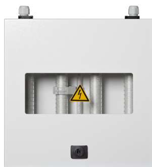
MAXiiMUS P40 (voor)