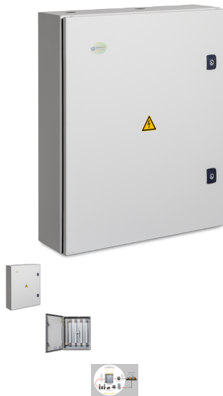
De Maxiimus M100

De MAXiiMUS harmoniseert en neutraliseert elektromagnetische straling en maximaliseert de energie in een gebouw. Bereik: 45 meter.